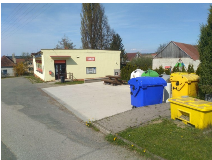
Obr. 3: Prodejna potravin s veřejným prostranstvím na návsi.