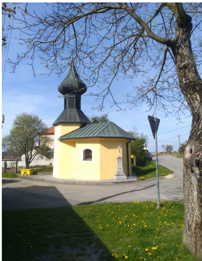
Obr. 1: Kaple sv. Anny.