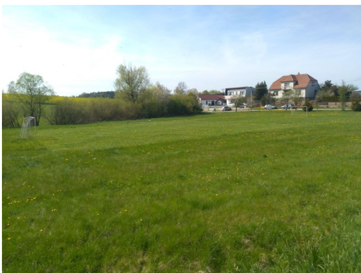
Obr. 9: Sportovní hřiště v části obce Kartouzy.