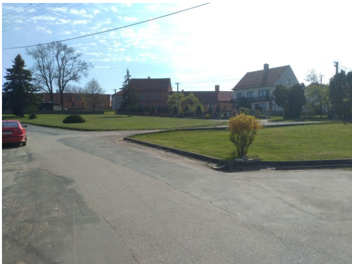
Obr. 5: Prostor návsi směrem od severu.