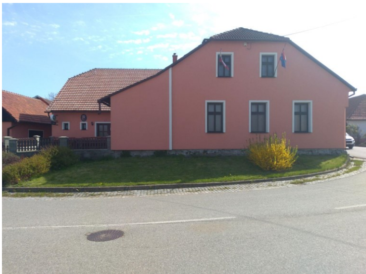
Obr. 2: Budova obecního úřadu.