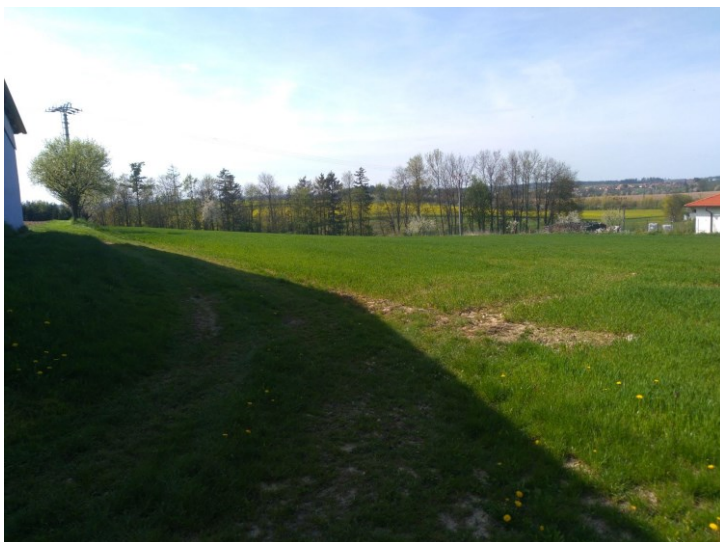
Obr. 6: Nevyužitá zastavitelná plocha Z7 smíšená výrobní.