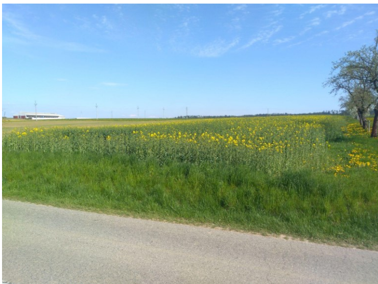
Obr. 12: Nevyužitá zastavitelná plocha Z2 u výjezdu na Katov.