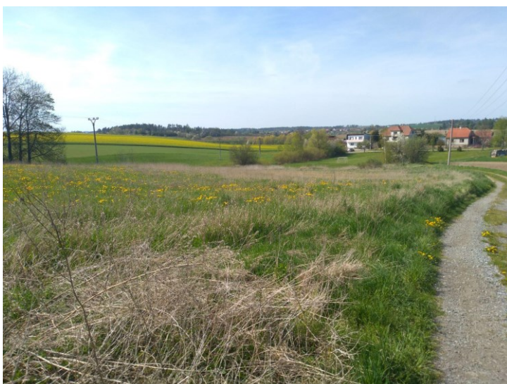
Obr. 7: Nevyužitá zastavitelná plocha Z6 smíšená výrobní + rozšíření sportovního hřiště.