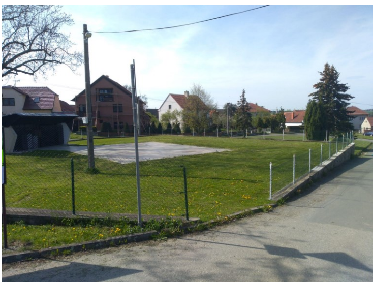
Obr. 4: Výletišťe jako součást návsi.