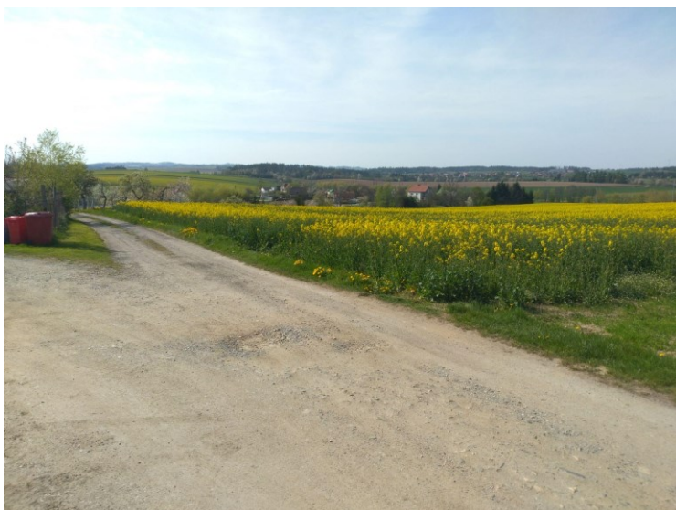
Obr. 13: Nevyužitá zastavitelná plocha Z3 mezi výjezdem na Katov a vodní nádrží.