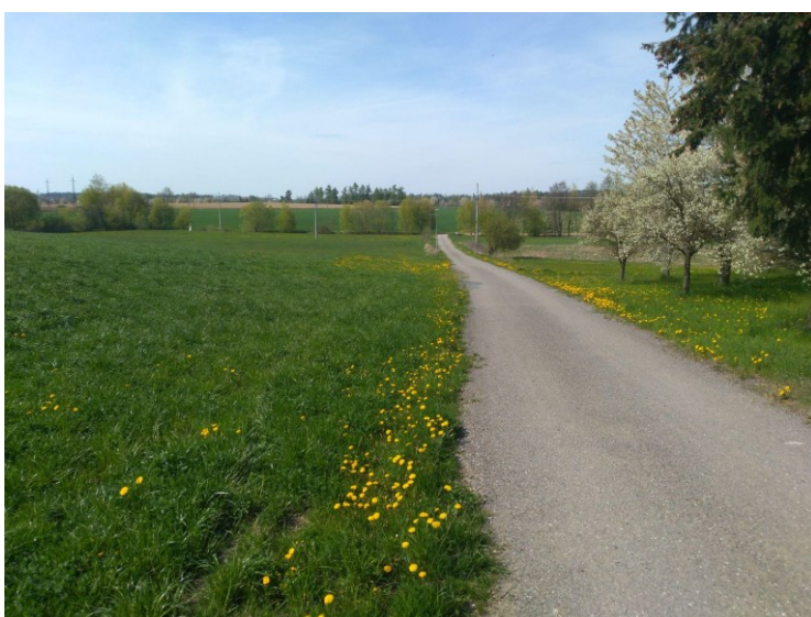
Obr. 10: Zrealizovaná komunikace k vlakové zastávce Níhov (zastavitelná plocha Z10).