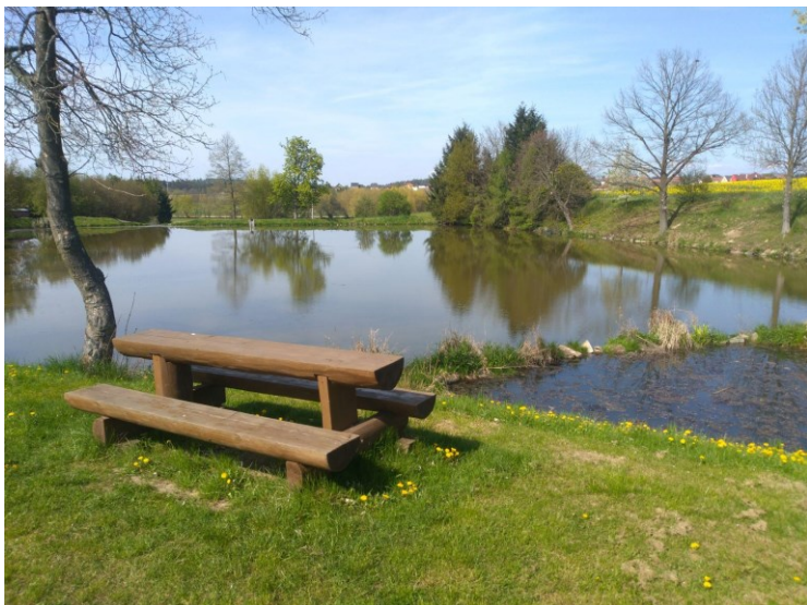
Obr. 11: Vodní nádrž na severu obce s veřejným prostranstvím.