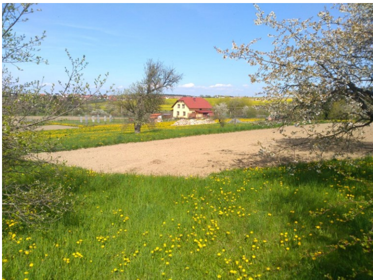
Obr. 8: Takřka nevyužitá zastavitelná plocha Z4.